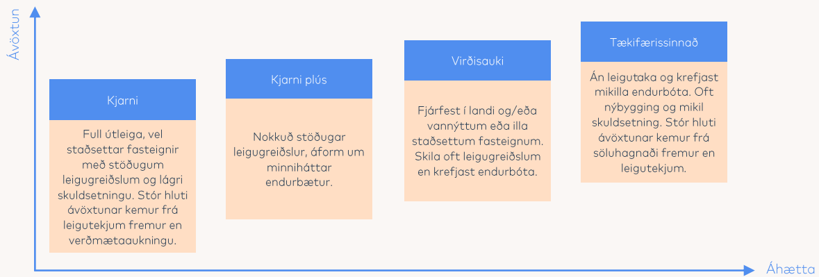
Mynd 2. Helstu flokkar fasteignafjárfestinga.

Fasteignafjárfestingar (e. Real estate) eru fjárfestingar í íbúðar- og/eða atvinnuhúsnæði þar sem markmiðið er að hámarka tekjur af fasteigninni á eignartímabilinu og þar með verðmæti hennar. Tekjur geta komið frá endursölu fasteigna eða í gegnum fyrirsjáanlega leigu. Þegar tekjurnar eru í formi fyrirsjáanlegrar leigu er áhættan og vænt ávöxtun að jafnaði minni en þegar tekjurnar koma frá endursölu. Kjarnahluti Frjálsa samanstendur af kjarna og kjarna plús fjárfestingum en kryddhluti eignasafnsins eru svokallaðar virðisauka og tækifærissinnaðar fjárfestingar (mynd 2).