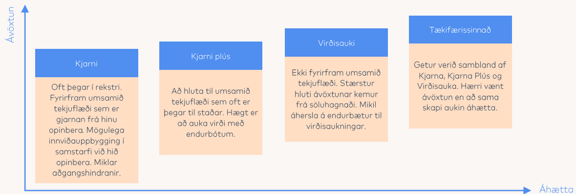
Mynd 3. Helstu flokkar innviðafjárfestinga.

Innviðafjárfestingar (e. Infrastructure) eru fjárfestingar í innviðum sem hafa það markmið að hámarka tekjur á eignartímabili og þar með verðmæti fjárfestingarinnar. Margt getur flokkast undir innviði en helst má nefna efnahagslega innviði svo sem verkefni eða félög tengd samgöngum, veitum, samskiptum orku o.s.frv. og samfélagslega innviði þar á meðal menntun, heilbrigðiskerfi, öryggi tengdu almannahagsmunum o.s.frv. Hér er oft um samstarf einkaaðila og hins opinbera að ræða. Kjarnahluti Frjálsa liggur hér líkt og í fasteignafjárfestingum í kjarna og kjarna plús fjárfestingum og kryddhlutinn í virðisauka og tækifærissinnuðum fjárfestingum (mynd 3).