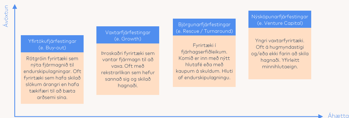
Mynd 1. Helstu flokkar framtaksfjárfestinga.

Framtaksfjárfestingar (e. Private equity) eru fjárfestingar í óskráðum hlutabréfum með það markmið að auka verðmæti fjárfestingarinnar með virkri aðkomu. Framtaksfjárfestar eru því oft í ráðandi stöðu innan fyrirtækis og geta þannig haft áhrif á reksturinn. Framtaksfjárfestingum er oft skipt niður í flokka (mynd 1) eftir vaxtastigi þeirra fyrirtækja sem fjárfest er í. Áhersla Frjálsa í kjarnahluta eigna er að mestu í yfirtökufjárfestingum en einnig að hluta í vaxtafjárfestingum. Á móti samanstendur kryddhlutinn af björgunarfjárfestingum og nýsköpunarfjárfestingum.